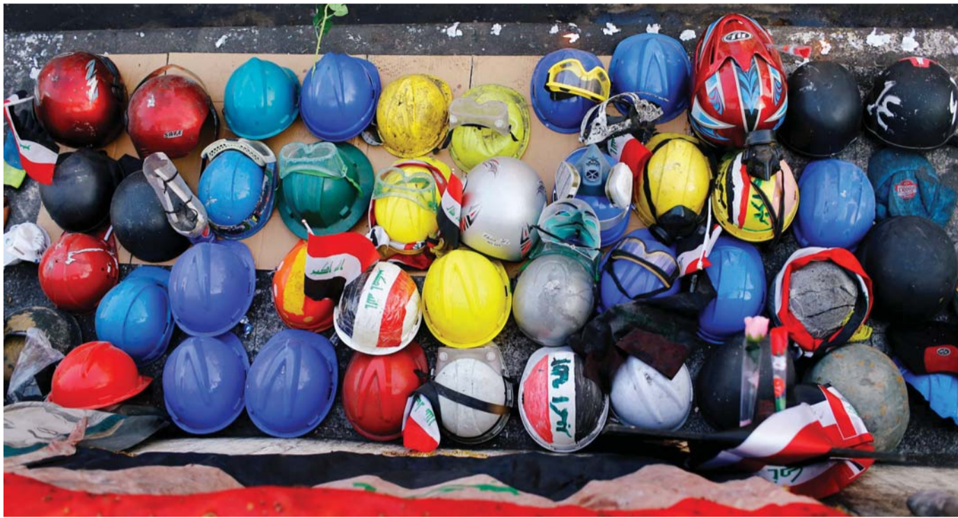
من قتلهم يا وزير الداخلية