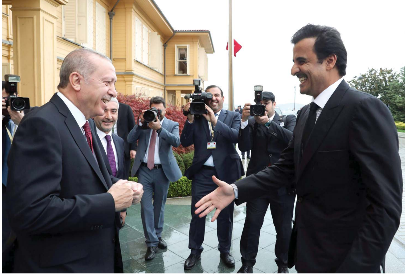
أردوغان يتسلم من الشيخ تميم عصا القيادة

استثمارات ضخمة وتعاون وثيق مع أنقرة للسيطرة على المؤسسات الإسلامية في أوروبا والعالم