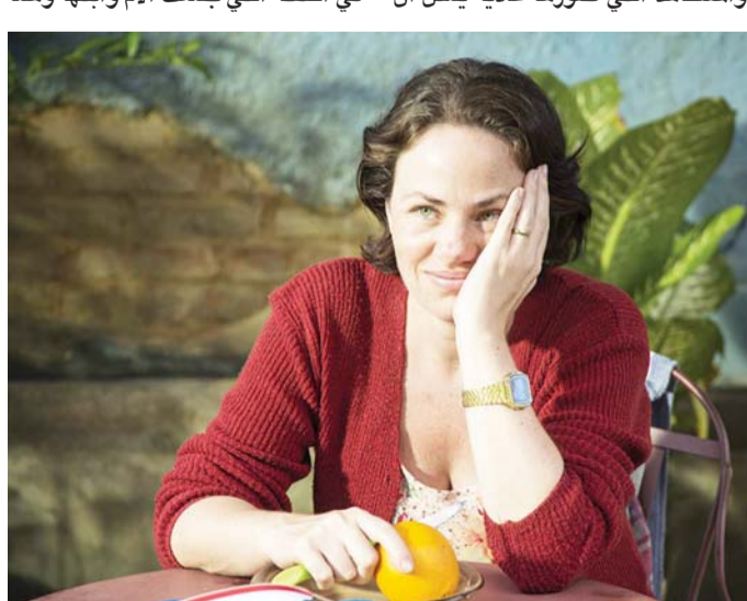
في انتظار غد أفضل

يراها الناس في أي مدينة في العالم. وفي لقطات جميلة مبالغتها، أوجد المخرج غوستافو بيرزي، تصورات سينمائية بالغة الجمال والدقة، خاصة في اللقطة التي جمعت الأم وابنتها وهما