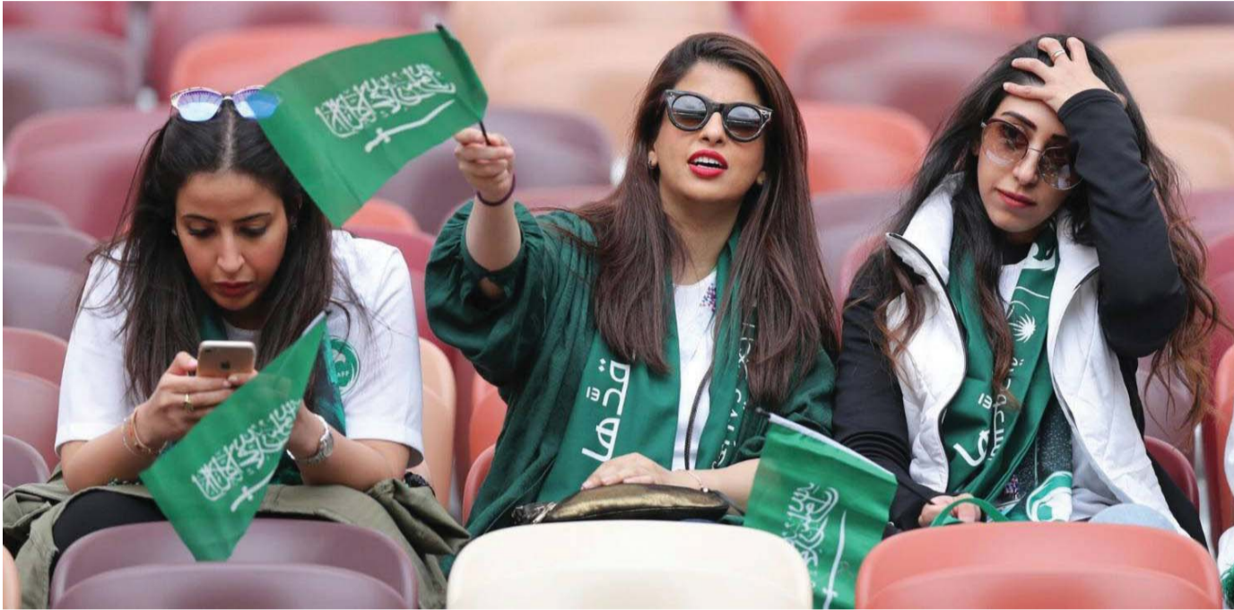
على درب التغيير المتواصل

الرياض تتفوق على الدوحة بنيل احتضان المسابقة لثلاثة أعوام بدءاً من العام المقبل