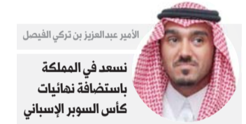
الأمير عبدالعزيز بن تركي الفيصل

السعودية تفوقاً على صعيد احتضان المسابقات العالمية في مختلف الرياضات بنيلها، الاثنين، شرف استضافة كأس السوبر الإسباني لمدة ثلاثة أعوام بدءاً من العام المقبل بعد منافسة مع عدة دول أبرزها قطر. وستستضيف السعودية مسابقة كأس السوبر الإسبانية لكرة القدم بمشاركة أربعة فرق في خطوة تأتي في سياق تعزيز المملكة لحضورها على الساحة الرياضية.