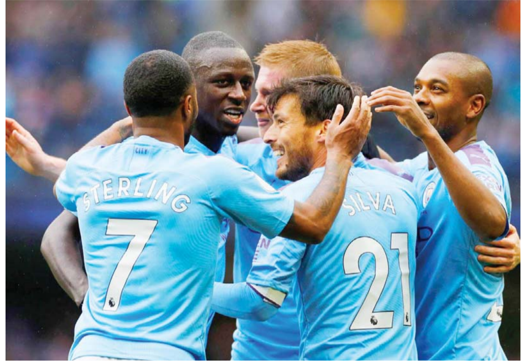
مجموعة متحررة من كل الضغوط

وتابع "الرابطة الإسبانية رائدة في هذا المجال وتحاول منذ أعوام إقامة مباراة أولى من البطولة خارج البلاد.