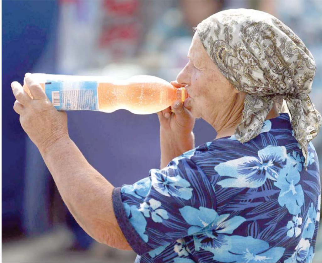
المشروبات الغازية تفرغ العظام من المعادن

لعدد بلغ 8359 امرأة تفوق أعمارهن الخمسين وتعرضن لكسر في مفصل الفخذ بين عامي 2008 و2013. ولم يكن لأي منهن تاريخ مرضي بالإصابة بهشاشة العظام أو كسر سابق في مفصل الفخذ أو تناول أدوية لتحسين كثافة عظامهن. وأكثر من نصف النساء اللائي شملتهن الدراسة كن في الثمانين من عمرهن على الأقل عند تعرضهن لكسر في مفصل الفخذ للمرة الأولى. وأغلب النساء كن يعانين من مشكلات صحية أخرى مزمنة.