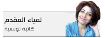
لمياء المقدم كاتبة تونسية

في بعض الحالات نحن نكرر النموذج الأسري الذي تربينا عليه في طفولتنا، لأنه النموذج الآمن بالنسبة لنا رغم كل ما به من مساوئ، وأمنه يتأتى من معرفتنا