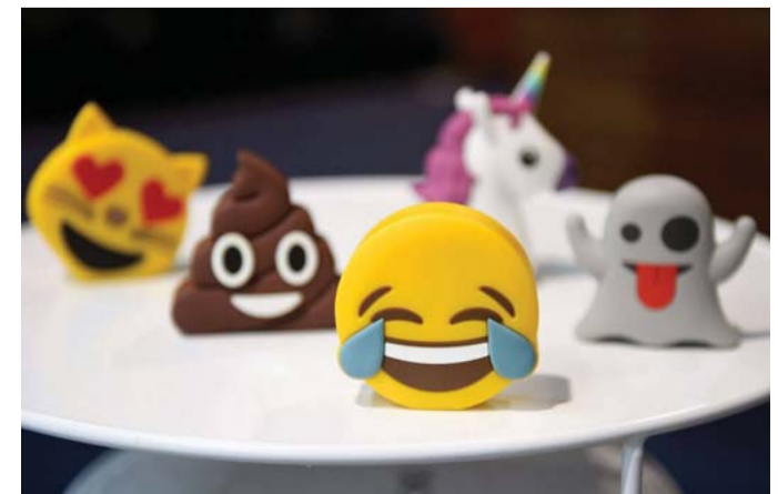
بديل للتعبير غير اللفظية

واعتبرت تينا غانستر المتخصصة بعلم النفس الاجتماعي أن الإيموجي "طريقة مبدعة للتعامل مع صعوبات الاتصال الرقمي"، مشددة على أنها تمثل بديلا عن التعابير غير اللفظية في الحياة الواقعية كلفة الوجه والجسد ونبرة الصوت غير المتوفرة في النصوص المكتوبة.