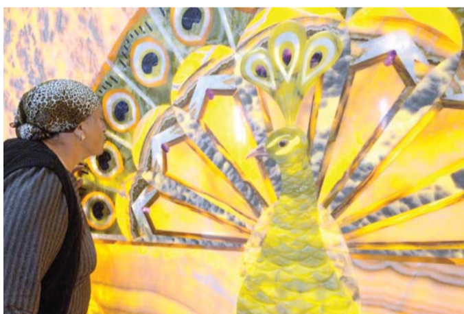
طاووس ملك الرمز الشهير للإيزيديين