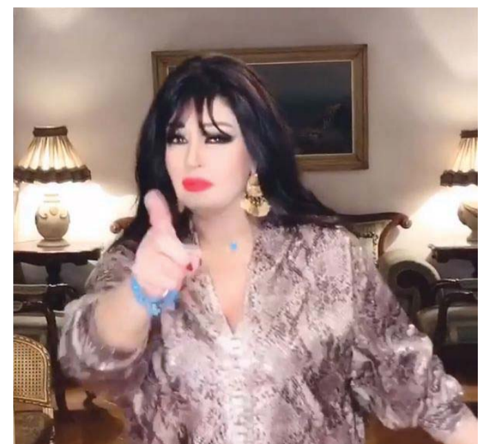
فصل ترفيهيها خلال الأزمات السياسية

وقالت أخرى: noorahmed415 مهزومة كثير وروحك حلوة. وقالت أخرى: rimaa.iq تملني.. هناك من الناس من يسمعون اغاني حزينة ويتأثرون وأنا أرقص عليها.