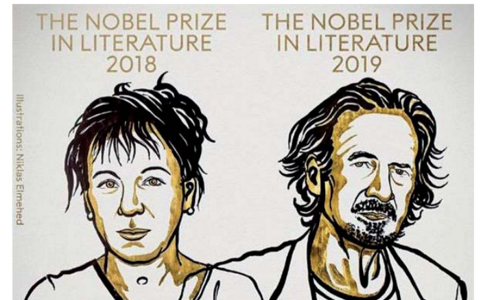
الأديب الكاميرا والكاتبة الطائرة

وتستعرض الكاتبة في روايتها حكايات عن السفر عبر الزمن، وتربط ذلك بشكل فني بجسم الإنسان، والتي تستنتج من خلاله طرق الحياة والموت والحركة والهجرة.