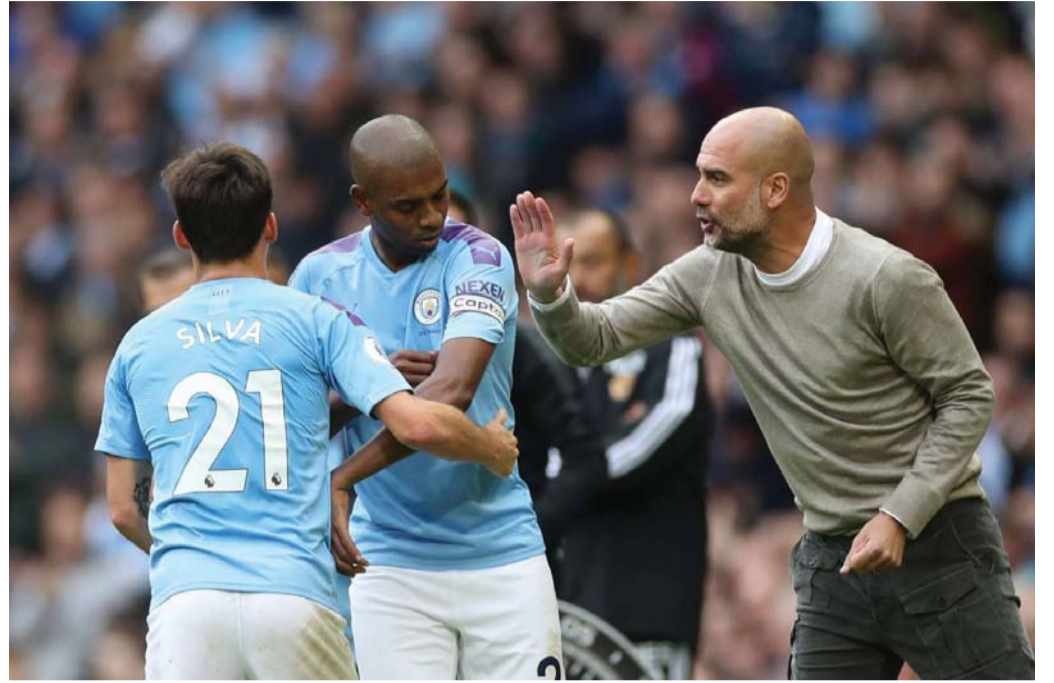
لا نفقد الأمل

وقال ياماموتو “إنني سعيد بحصولي على فرصة قيادة سيارة في فورمولا-1، هو كان حلمًا بالنسبة لي منذ الطفولة”. وأضاف “الحصول على هذه الفرصة على مضمار سوزوكا، الذي يحتل مكانة خاصة لدى كل السائقين اليابانيين، وأمام جمهور كبير من