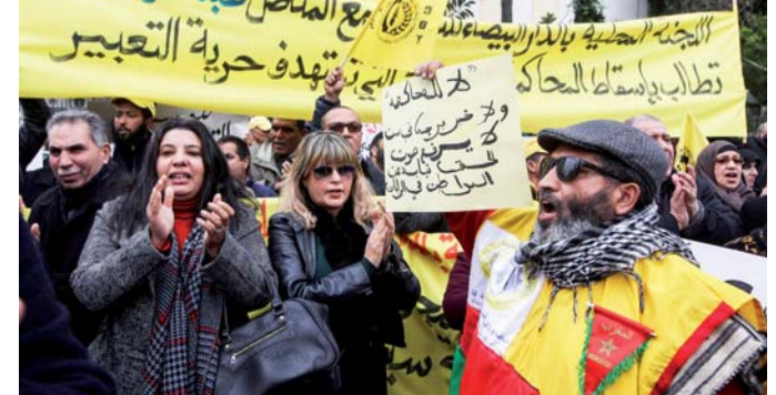
صوت جديد ينضم لأصوات الصحفيين

ودعا النيابة العامة إلى "عدم تحريك أي متابعة بشأن جرائم السب والقذف في حق الصحفيين إلا بعد