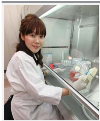
هاروكو أوبوكاتا من معهد ريكن الياباني توصلت لطريقة بسيطة لإعادة خلايا حيوانية إلى حالة جذعية محايدة في ذروة الحيوية

الأدوية الكبرى للاستحواذ عليها. كما أن غموض السباق نحو انقلابات الطب التجديدي يفتح المجال واسعاً أمام رأس المال المغامر للبحث عن أصحاب الابتكارات وتقديم تمويلات صغيرة يمكن أن تحقق أرباحاً هائلة في حال نجاحها على نطاق عالمي.