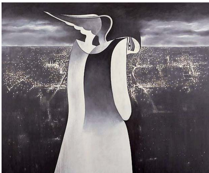
المرأة الكاتبة ناضلت للتحري (لوحة للفنان صفوان داخول)

والندوة التي أقيمت في ذكرى وفاة المتنبي في 23 سبتمبر 965 ميلادي، تحت شعار "المتنبي: ولا يزال مالى الدنيا وشاغل الناس"، تمثل نافذة لاسترجاع أمجاد أشهر شعراء العرب وأكثرهم تداولاً في ما كتب أو في ما يخص سيرته وحياته التي كانت متقلبة وتعكس تقلب الأوضاع في الحقبة التي عاش فيها.