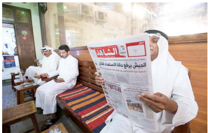
كويتيون يتطلعون لمرور العاصفة

ليبيا 1 دينار - السعودية 2 ريال - مصر 3 جنيه مصري - موريتانيا 120 أوقية - تونس 900 مليم - المغرب 3 درهم - الجزائر 7 دينار - البحرين 200 فلس - اليمن 50 ريالا - الكويت 150 فلسا - الإمارات 2 درهم - عمان 200 بيزا - قطر 2 ريال - العراق 2000 دينار - الأردن 500 فلس - سوريا 150 ليرة - السودان 50 دينارا AUSTRIA 2 € - BELGIUM 2 € - CYPRUS 2 € - FRANCE 2 € - GERMANY 2 € - GREECE 2 € - ITALY 2 € - TURKEY 2.350.000 TL (YTL2.35) - MALTA 2 € - NETHERLANDS 2 € - SPAIN 2 € - SWEDEN 13 KR - SWITZERLAND 3SF - USA 5 $ - UK 4 £