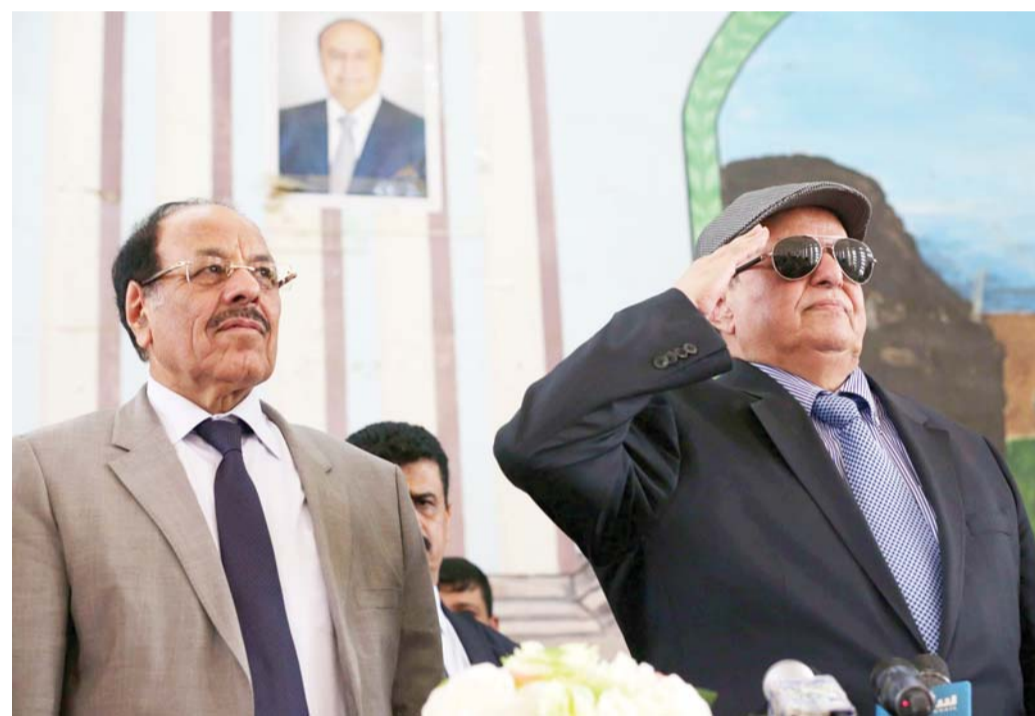
القرار بيد الرئيس أم الإخوان

انزعاج سعودي من تعيين وزراء ومسؤولين عرفوا بمعاداة التحالف العربي