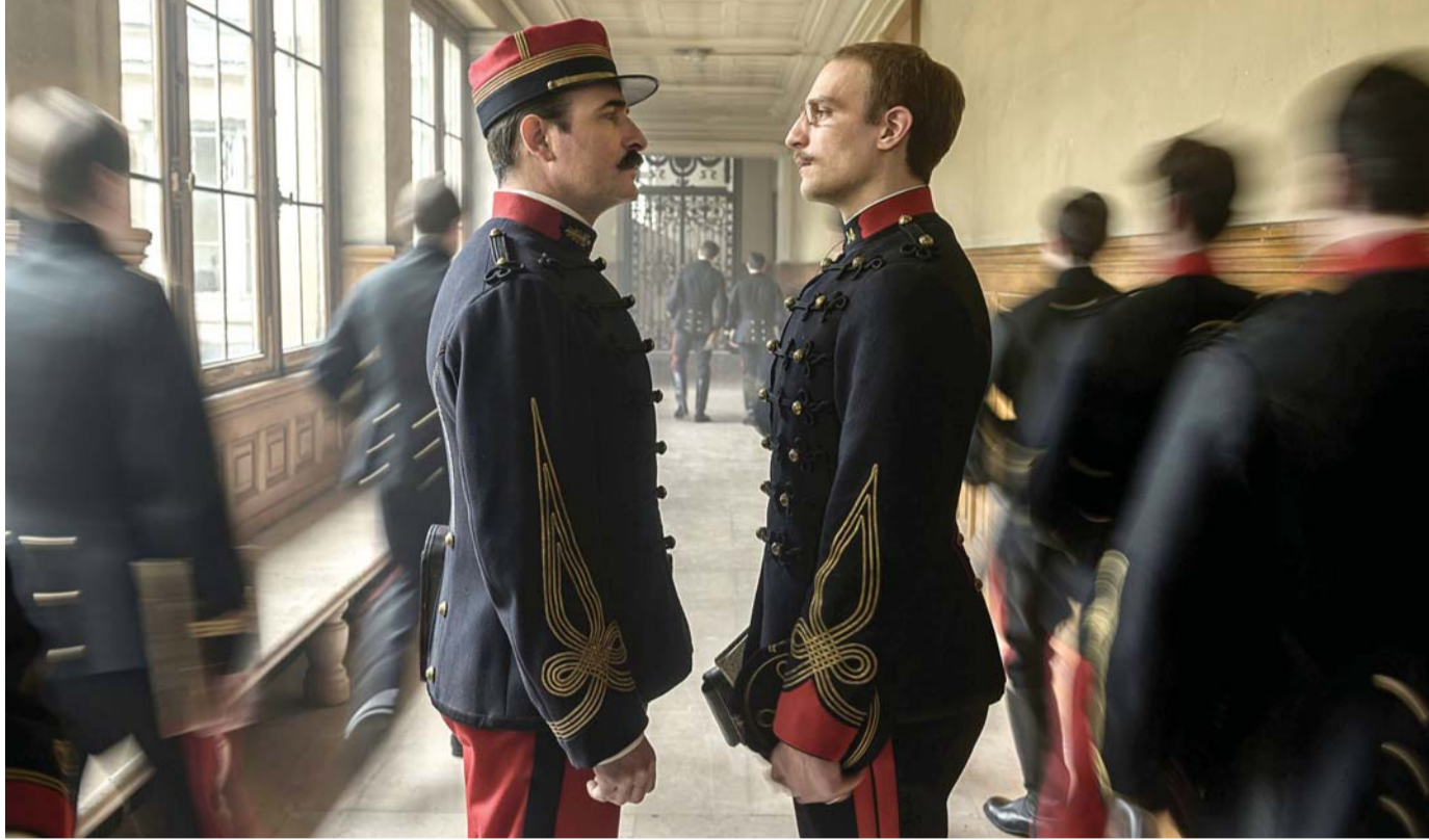
المواجهة بين الضباط

قضية ألفريد دريفوس التي استمرت في فرنسا من عام 1894 حتى 1906، بدأت بإدانة دريفوس بتهمة التجسس لحساب ألمانيا. ورغم ما ثبت بعد ذلك من أن