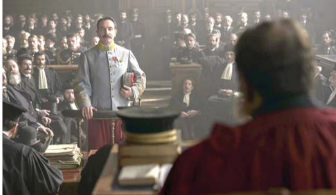
صمود بيكار الضابط أمام المحكمة

وفي دور الكولونيل هنري لدينا ممثل من الوزن الثقيل هو غريغوري غيدوبا الذي يؤدي الدور معبراً عن خبث الضابط وما يخفيه في أعماقه أكثر مما يتكشف عنه، بتعبيرات عينيه وإيماءاته وحركة جسده. إنه نموذج للممثل السينمائي الذي يعرف كيف يعبر في بلاغة أمام الكاميرا.