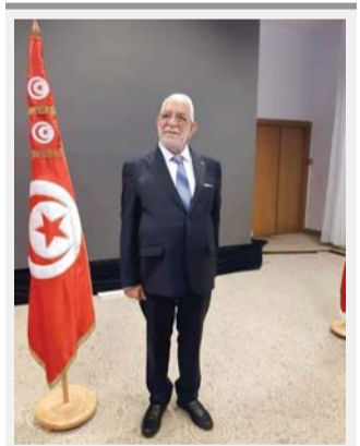
صفحة مورو أغفلت نشر صور المرشح بالبدلة بدا فيها مثيراً للسخرية

ويذكر أن التونسيين أولوا اهتماماً كبيراً بملابس المرشحين الجدد لرئاسة الجمهورية. وفيما حصد كثيرون الاطراء تلقى آخرون انتقادات لاذعة.