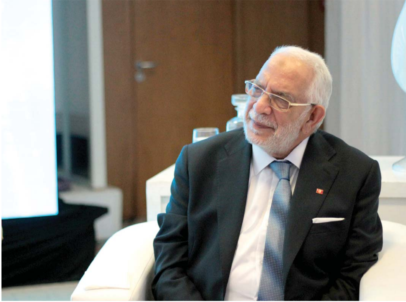
الأستاذ يرتدي البدلة