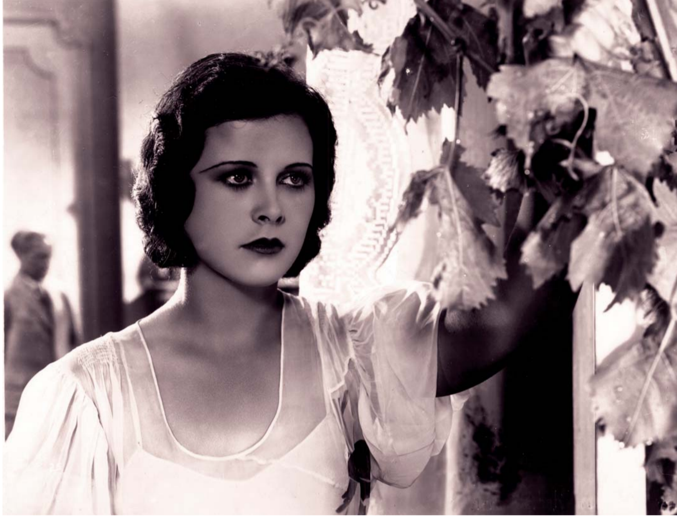
اعتبر الفيلم في زمانه عملا شديدا للجرأة

عودة الفيلم- الفضيحة إلى مهرجان فينيسيا بعد 75 عاما