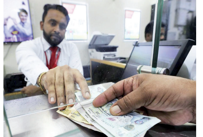
توسيع آفاق مناخ الأعمال

كما جاءت في قائمة العشرة الأوائل عالمياً في 5 من أصل 10 محاور تتمثل في استخراج تراخيص البناء والحصول على الكهرباء وتسجيل الملكية وإنفاذ العقود ودفع الضرائب، بينما حافظت على صدارتها في محور الحصول على الكهرباء. إلى أحدث بيانات شركة فيزا حول التجارة الإلكترونية للإمارات، تصدر الدولة الخليجية لقائمة أسرع الأسواق نمواً في هذا المضمار على مستوى الشرق الأوسط وشمال أفريقيا. وبفضل سهولة ويسر القوانين تمكنت الشركات من مزاوله أعمالها، إلى جانب الإجراءات المتبعة في الرقابة على المواقع الإلكترونية مما يعزز من ثقة المستهلكين في الشراء الآمن.