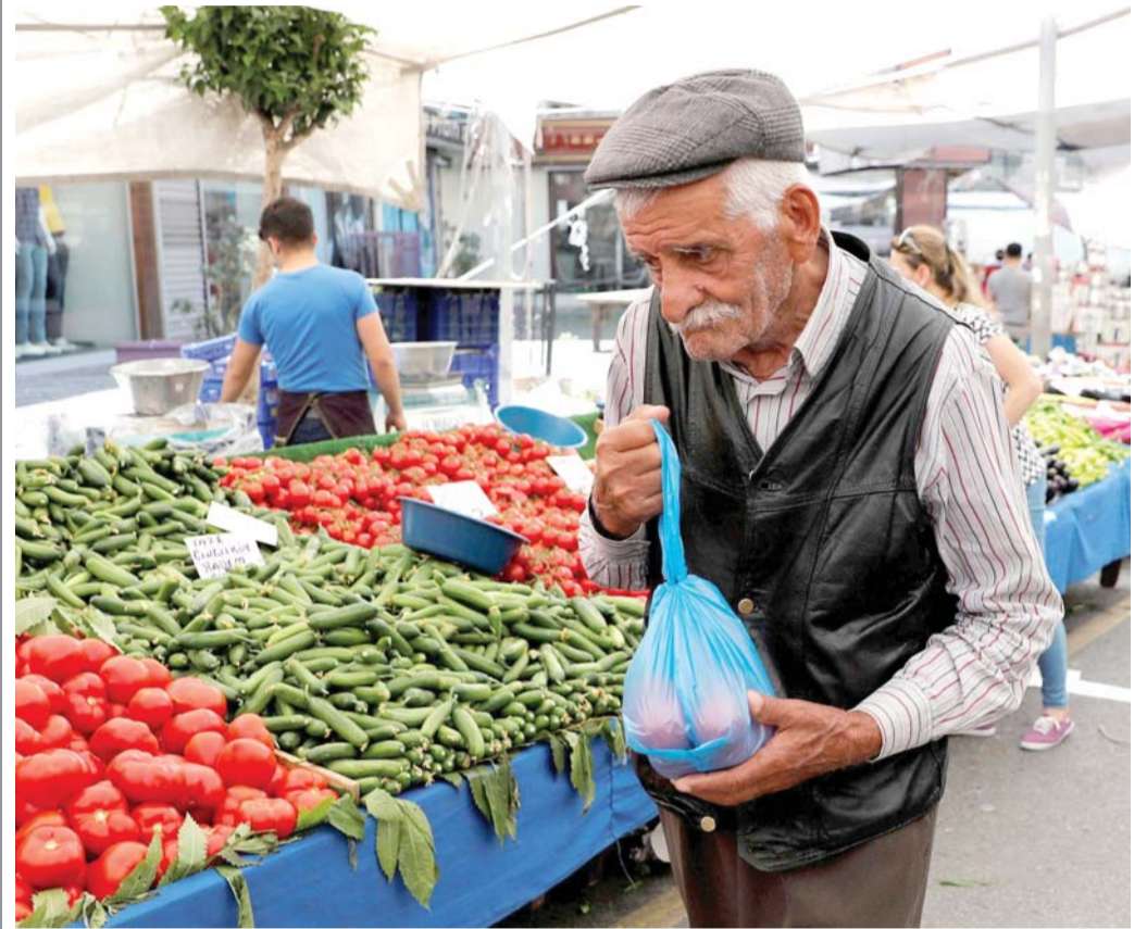
مغامرات أردوغان ترهق جميع الأتراك

قرار فيتش يزلزل الثقة الهشة بالاقتصاد التركي