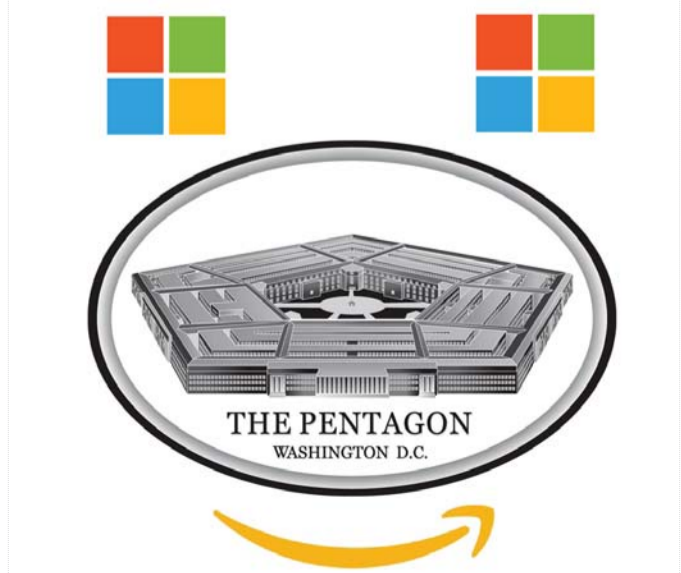
مغامرة بصندوق الأسرار العسكرية أم ثقة بتكنولوجيا البيانات السحابية

الاحتفاظ بأسرارها العسكرية. وكانت شركة غوغل قد أبدت اهتماماً بالمنافسة على تقديم عطاء مشروع جدي لكنها أعلنت انسحابها في العام الماضي قائلة إنها غير متأكدة من أنه يتماشى مع قواعد الذكاء الاصطناعي لدى الشركة. وقاتي المنافسة على عقد البنتاغون في وقت تتصاعد فيه الهجمات على النفوذ المتزايد لشركات التكنولوجيا العملاقة، حيث تزايد عدد المشرعين والمسؤولين المحليين بتقليص نفوذها. ووصلت حد المطالبة بتقسيم تلك الشركات.