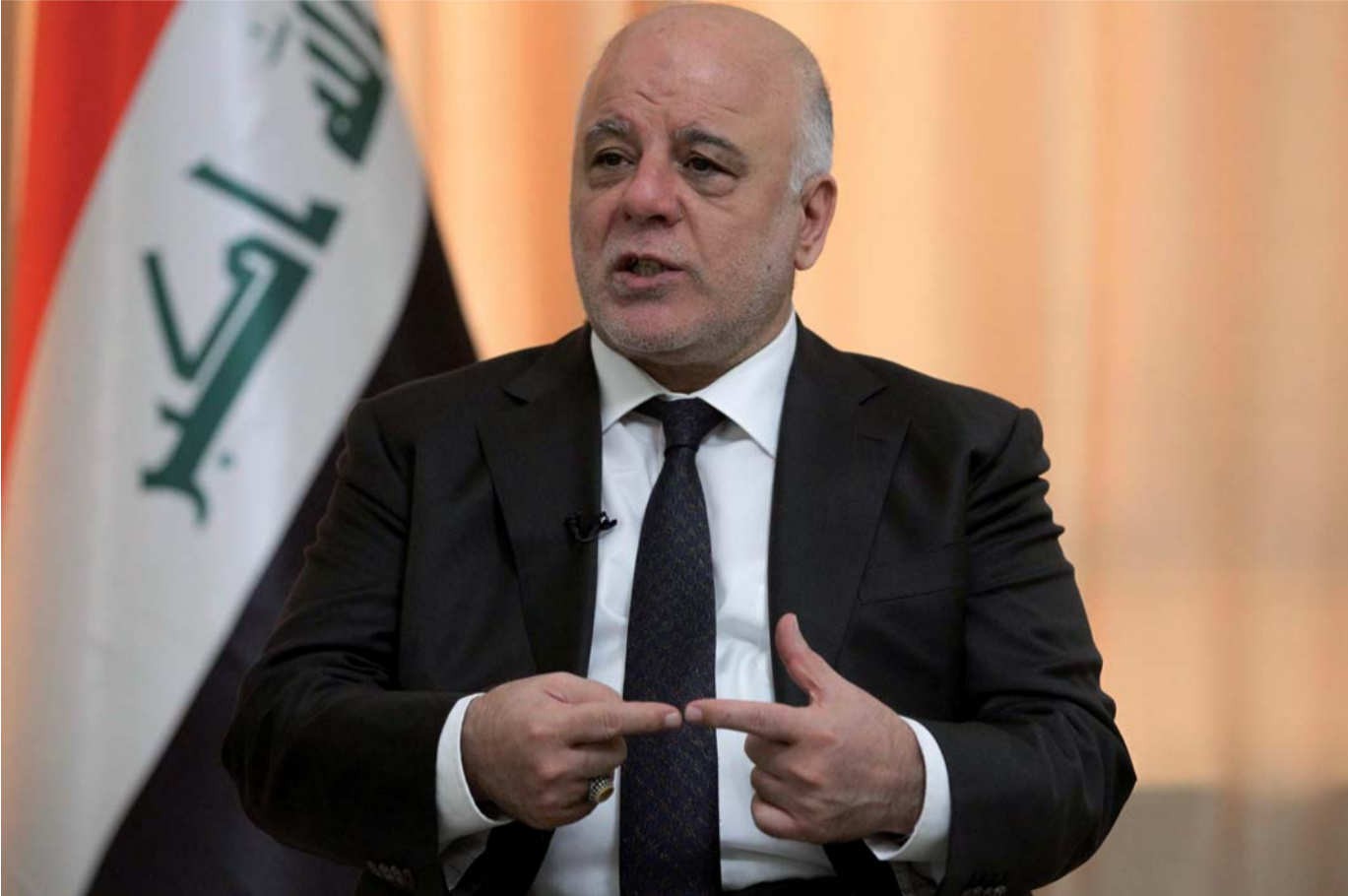
حيدر العبادي: على الحكومة الحالية العودة إلى قرارات اتخذت في فترة حكمنا

وكتب أرعي، على تويتر، إن "أقوال التجسس والتكبر لدى نصرالله على منظمته وإنجازاته الوهمية لا يمكنها إخفاء الحقيقة من وراء رسالته. الأزمة كبيرة جدا، ليست المالية فحسب، بل الأخلاقية أيضا. عندما يتذمر عناصر حزب الله بأن لا مال لديهم، هذا يعني أن الأزمة خانقة".