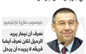
جوسيب ماريا بارتوميو

لا يهم إذا كان نيمار هو نيمار، أو (البرتغالي) كريستيانو رونالدو هو رونالدو. النادي هو مؤسسة يجب احترامها. هو من سيقود المشروع وليس نيمار". ومنذ وصول نيمار، تعالت أصوات للتنديد بالمكثمة الخاصة التي يحظى بها، علماً وأن البرازيلي تمرد على قرارات الفريق بعدما كان قد قرر السفر إلى البرازيل قبل نهاية الموسم دون علم مدربه الألماني توماس توخيل. ولم تكن إنجازات النادي الباريسي في الموسم الماضي في مستوى آمال وتطلعات الفريق، إذ اكتفى بالاحتفاظ بلقبه بطلا للدوري الفرنسي، ولكنه جرد من لقبه في الكأس المحلية أمام رين بجسارته بركات الترجيح، كما خسر لقبه في مسابقة كأس الرابطة على يد غانغان في ربع النهائي، إلى خروجه من دور ثمن النهائي في مسابقة دوري أبطال أوروبا أمام مانشستر يونايتد الإنكليزي (فاز 2-0 ذهاباً وخسر 1-3 إياباً).