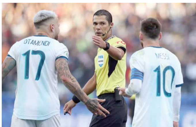
التحكيم نقطة سوداء

ويضاف إلى سجل هذه البطولة المتواضع جماهيرياً والأثر السلبي للتحكيم، أنه لم يفز أي منتخب من أميركا الجنوبية بكأس العالم منذ 2002، وهو رقم سلبي كما أنه ظهر منتخب واحد فقط من القارة الجنوبية من بين آخر ثمانية منتخبات بلغت النهائي رغم واقع حصد هذه القارة خلال القرن الماضي لنصف عدد الألقاب. وعلى مستوى الأندية يبدو الأمر أسوأ، حيث لم يحرز أي فريق من أميركا الجنوبية لقب كأس العالم للأندية منذ 2007، وفي سنتين في آخر ثلاث سنوات لم يترشح أي فريق من أميركا الجنوبية في المباراة النهائية. ويفسر المتابعون ذلك ويقدمون العديد من الأسباب المؤثرة لعل من بينها رحيل المواهب الشابة إلى أوروبا، لكن ما ساهم أيضاً في التراجع ربما هو إطلاق مسابقة دوري الأمم الأوروبية لأنها جعلت منتخبات أميركا الجنوبية منعزلة كثيراً عن أفضل منتخبات العالم. وكشفت دراسة الشهر الماضي أن خلال عام 2019 لعبت منتخبات أميركا الجنوبية العشرة 38 مباراة ودية من بينها مباراتان فقط ضد أوروبا.