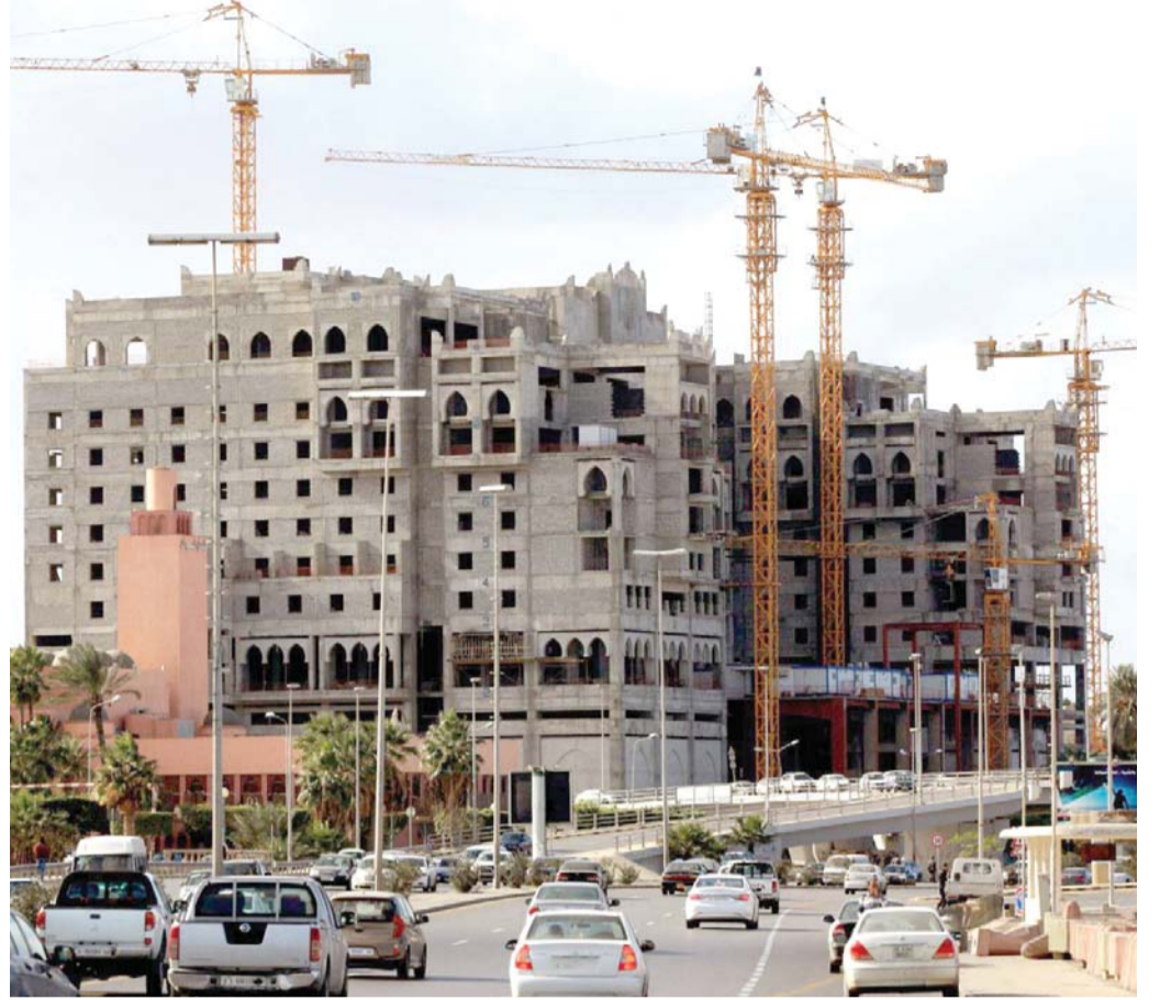
مشاريع معطلة حتى إشعار آخر

ويأتي اللقاء انسجاما مع تحركات مجلس الأعمال المشترك، حيث بدأ قبل فترة في بلورة برنامج تنفيذي للعاملين الحالي والمقبل يتضمن لقاءات بين غرف التجارة والصناعة وشركات القطاع الخاص في البلدين. ويمكن أن تستفيد تونس من الاتفاقيات التجارية، التي تربط الأردن مع دول العالم، مثلما يمكن للأردن الاستفادة من موقع تونس وعلاقتها مع الدول الأوروبية والأفريقية.